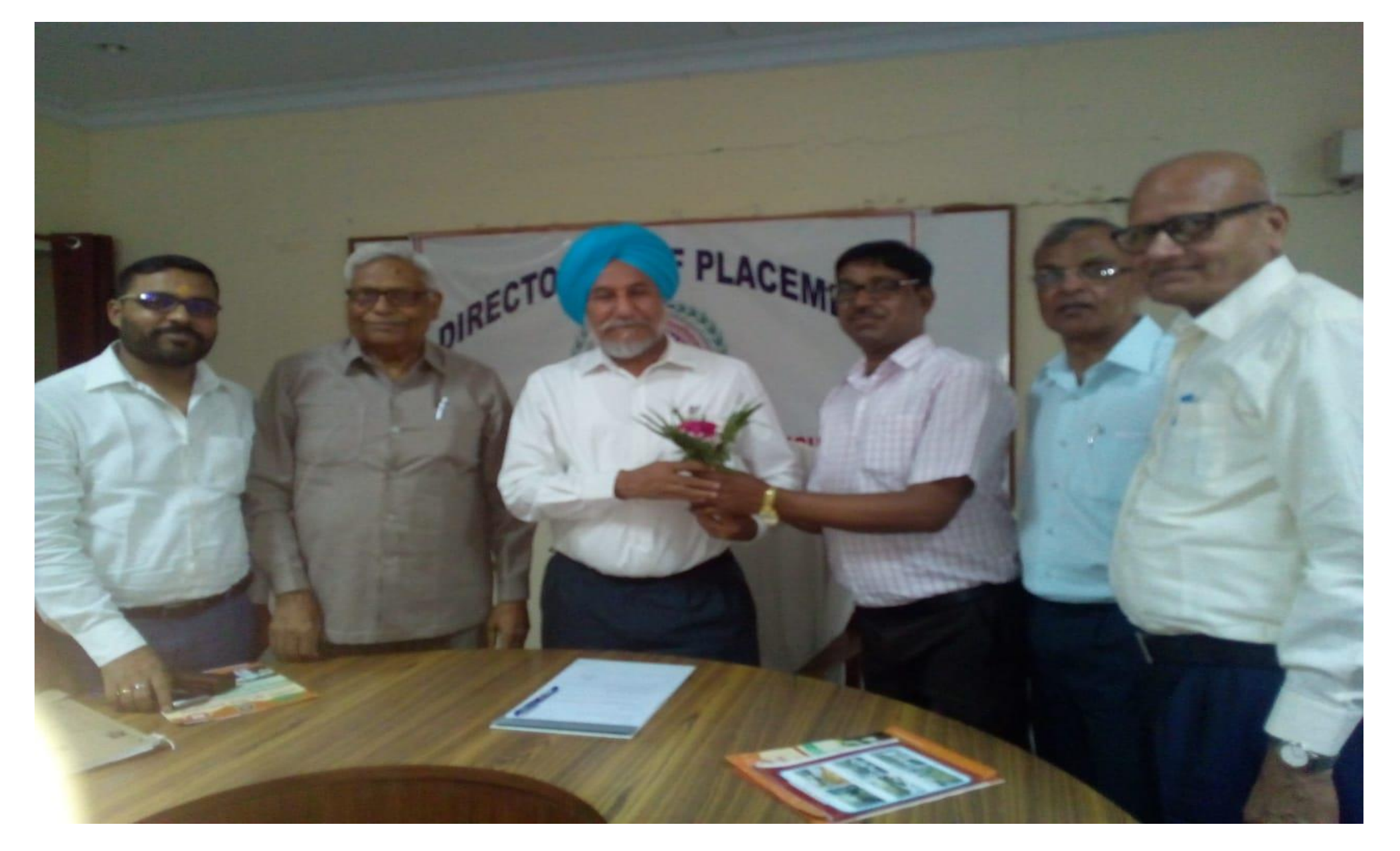
Experts of Bhavdiya Group of Institutes in the placement cell of the university on 10.05.19 for the placement drive for posts of Assistant Professors