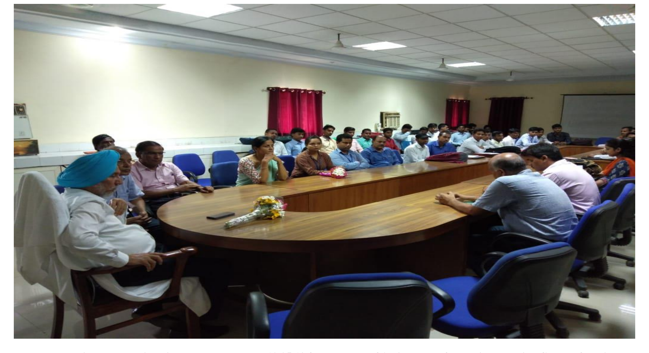
Placement drive by the university placement cell on 10.05.19 for the posts of Assistant Professors in Bhavdiya Group of Institutes