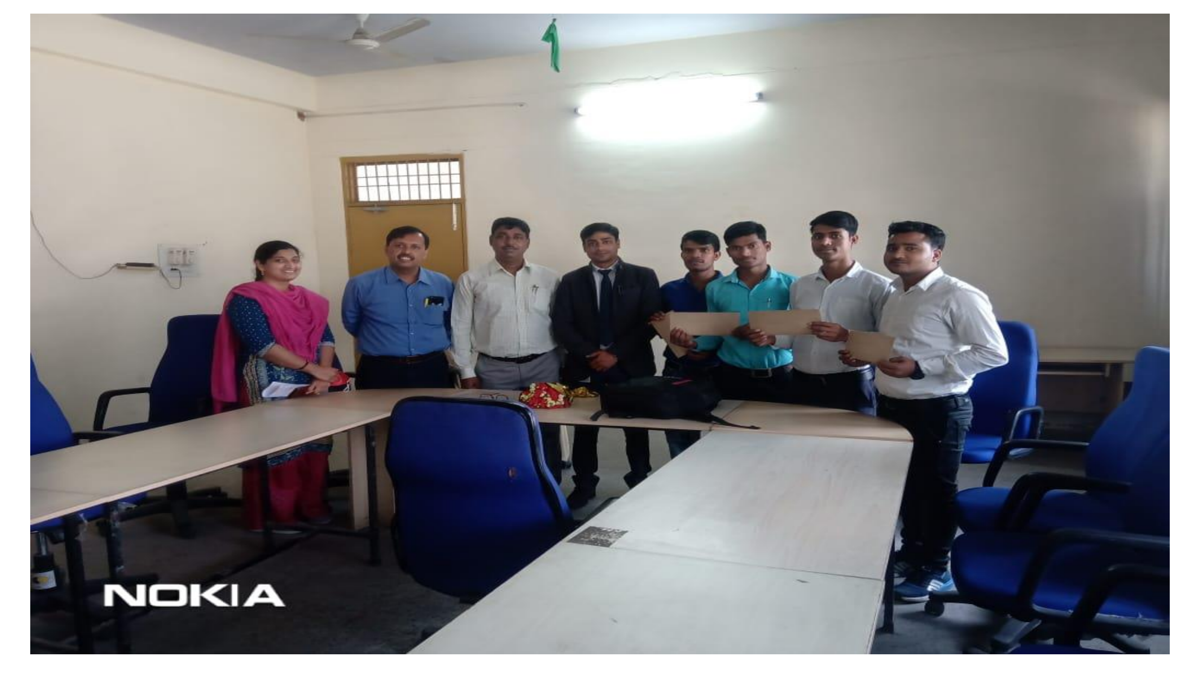
Placement of students by Radhika Biotechnology Pvt Ltd on 27 Feb. 2021