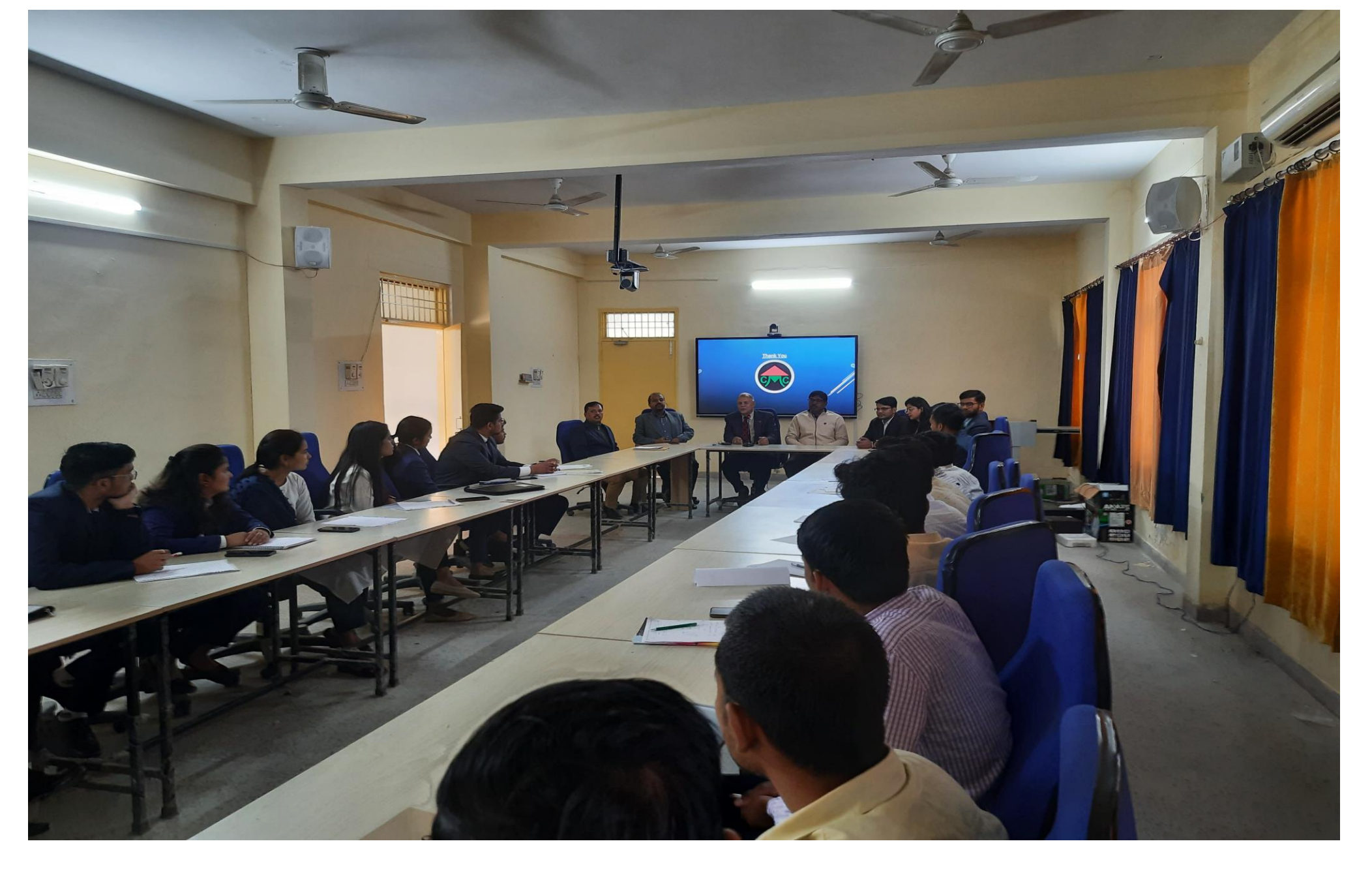
Campus interview for student of Master in Agribusiness by Casphor Microfinance PVT LTD on 19 February, 2022