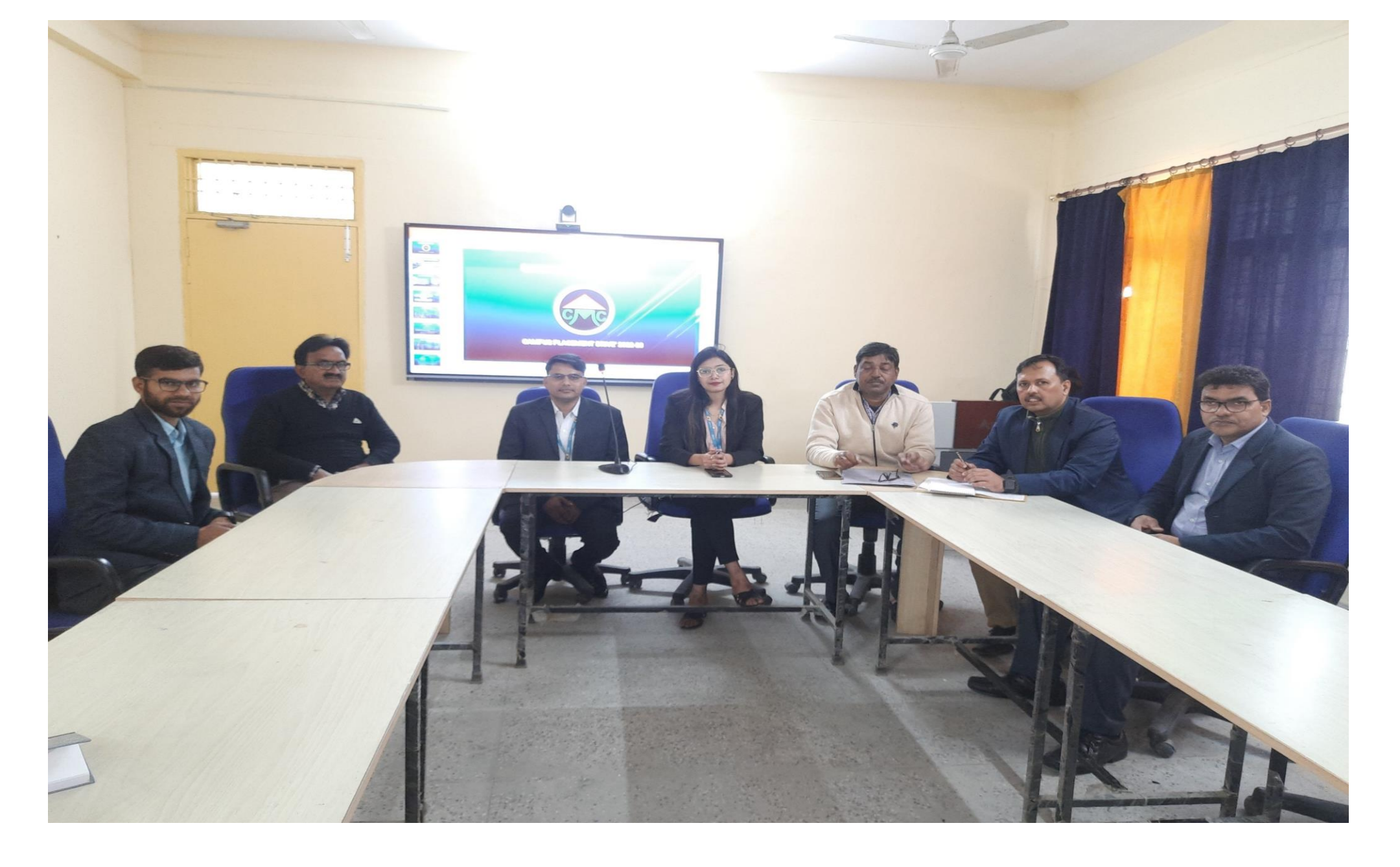
Campus interview for student of Master in Agribusiness by Casphor Microfinance PVT LTD on 19 February, 2022